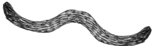
staart / tail