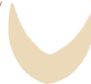
hoektanden / tusks